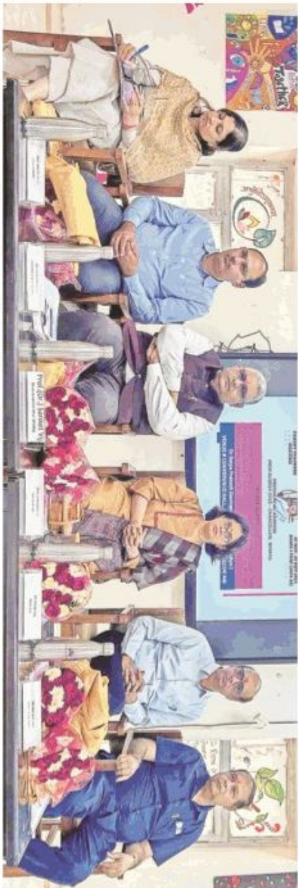
महिला विश्वविद्यालय के कार्यक्रम में मंचासीन अतिथिगण।