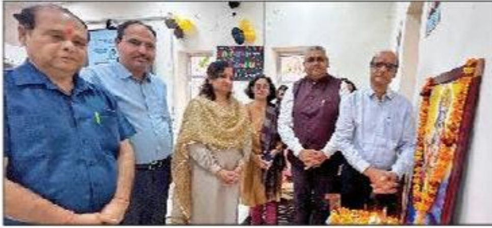
गोहाना। महिला विश्वविद्यालय में आयोजित इंडक्शन कार्यक्रम का दीप प्रज्वलित कर शुभारंभ करते हुए अतिथि।