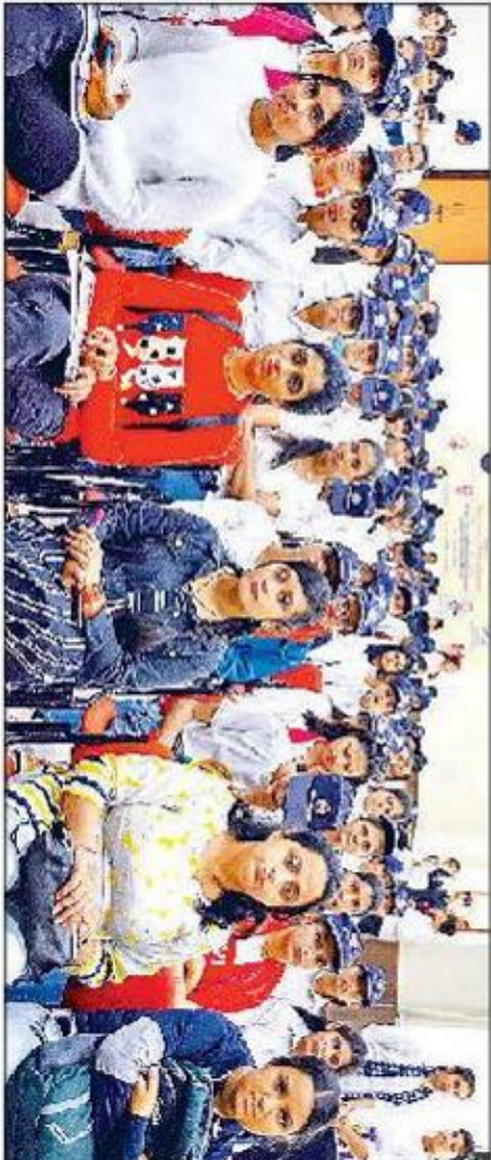
गोहाना। प्रसारण देखते हुए शिक्षक और छात्र।