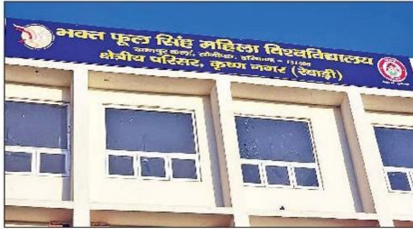
रेवाड़ी। कृष्ण नगर स्थित रीजनल सेंटर का नया भवन।