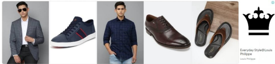
Everyday Style@Louis Philippe Louis Philippe