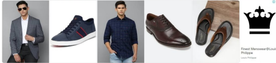
Finest Menswear@Louis Philippe Louis Philippe

Home / Punjab News / महिला विश्वविद्यालय की पीएम-उषा के तहत 20 करोड़ रुपये का अनुदान मिला